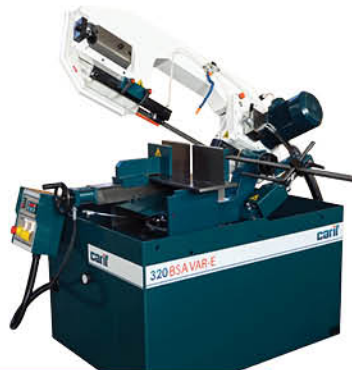
320 BSA | BSA VAR-E