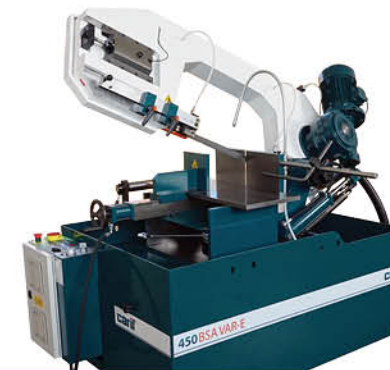
450 BSA | BSA VAR-E