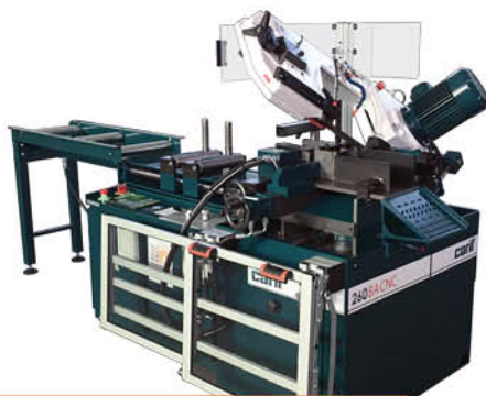
260 BA CNC