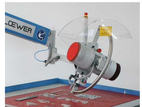
Schwenkbarer Schleifkopf 180 Grad für schnelle Verfügbarkeit von Entgrat- und Verrundungswerkzeug